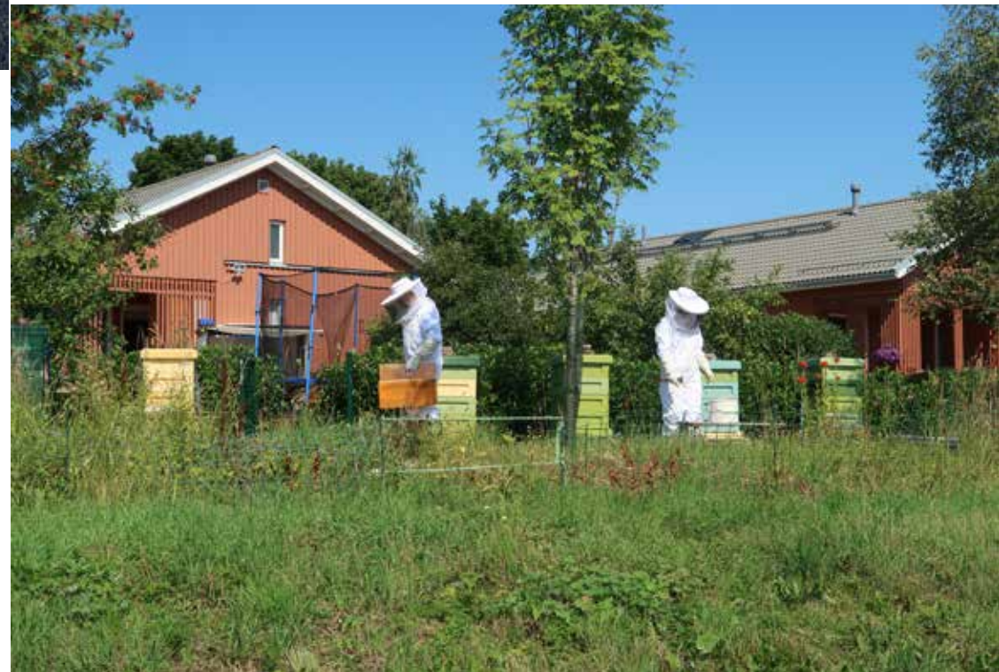
Mehiläistarhausta Fallåkerissa.

Viljeltyä maata siirtyy jatkuvasti asutuksen ja liikenteen tarpeisiin erityisesti Espoon etelä- ja keskiosissa. Vireillä olevan pohjois- ja keskiosien yleiskaavan kaavakartta osoittaa, että avointa maisemaa ja maanviljelykseen käytettävää peltoa tulee säilymään Keski- ja Pohjois-Espoossa myös tulevaisuudessa, vaikka muun muassa Vanhassakartanossa viljelysmaata ollaankin kaavoittamassa rakentamiselle. Maa- ja metsätalousalueita osoitetaan rakentamiseen muun muassa Histan, Mynttilän sekä Viiskorven uusien keskusten ympäristössä.