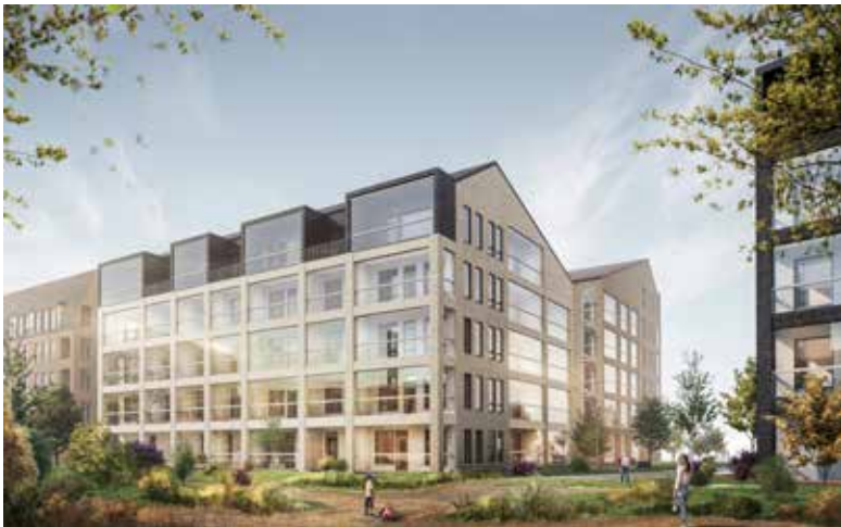
Suviniityn tulevaa asuinrakentamista (kuva: T2H/ arkkitehtitoimisto Cederqvist & Jäntti Oy)

Bussiterminaalien ja Espoontorin laajentamisen mahdollistava asemakaavaehdotus on ollut pitkään valmistelussa. Laajennussuunnitelma mahdollistaa uusia liiketiloja, asumista ja päivittäistavarakauppaa. Espoon keskuksen kaupalliset palvelut keskittyvät tulevaisuudessa Siltakadun ympärille. Espoon keskuksen linja-autoliikenne ohjataan Siltakadulta pääosin bussiliikenneterminaalien Espoontorin ja radan väliselle alueelle. Kaukana tulevaisuudessa toteutettavaksi suunniteltuun pikaraitioverkostoon varaudutaan tilavarauksilla.