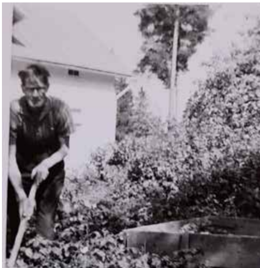
Elis i potatislandet

Barrås är en tvåvåningsvilla på 320 kvadratmeter från 1900-talets början. Den var mitt barndomshem från späda ålder till 1967 när jag var tio år. Vi bodde inte i hela villan, bara i en lägenhet på tre rum och kök i nedre våningen. Villan användes som tjänstebostäder för dem som jobbade på Esbo sjukhus, trähuskomplexet nedanför backen. I rummen i husets övre våning bodde det sjuksköterskor som inte hade familj. De var alla arbetskamrater till min mamma, och