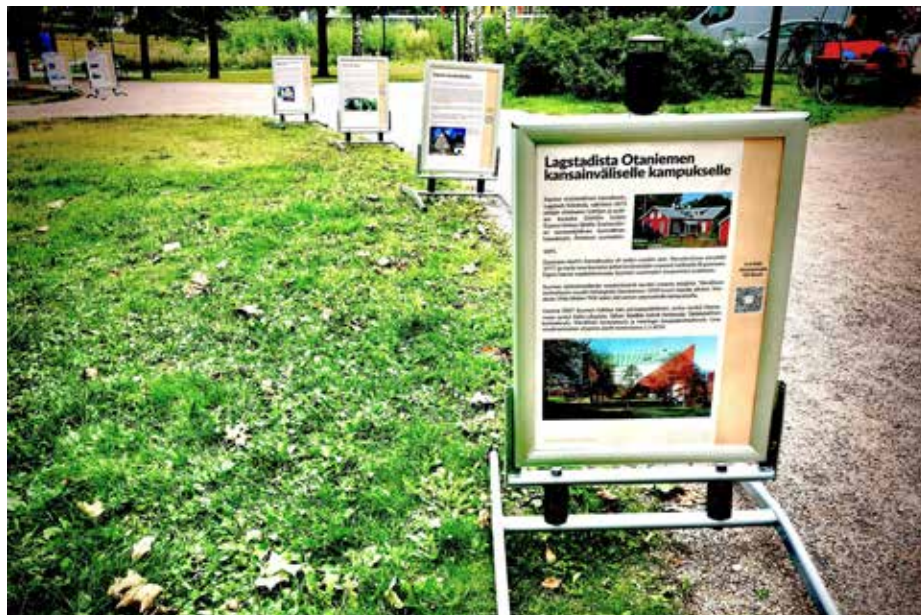
Historiapolku Espoon Juhlakarnevaaleilla.

Espoon kaupungin juhlavuosi 50 vuotta kaupunkina on tulossa päätökseen. Espoon perinneseuja tuotti yhteistyös-