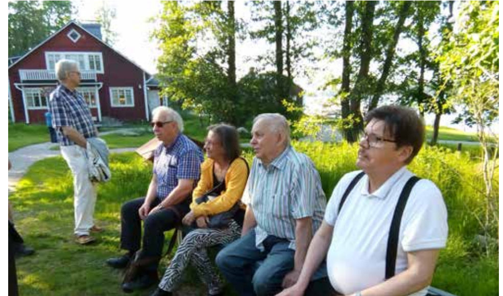
Puheenjohtajien retki Pentalaan 2019

Esimerkkinä alkuaikojen yhteistyöstä naapurijärjestöjen kanssa voi mainita mm. HELKA:n, EKYLin, Espoon kotiseututoimen (Kaupunginmuseo) ja Vantaan Kotiseutuliiton kanssa järjestetty ”Rokkaa rajalla – kaupunginjohtajat ja kan-