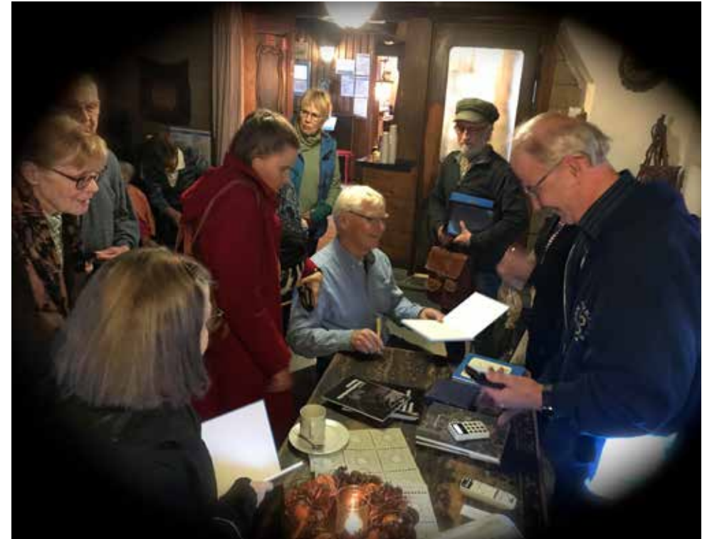
Bemböle – historiaa ja hölmöläistarinoita -kirjan julkistus Bembölen Kahvituvassa 26.10.2021.

Rautatie johdettiin 1900-luvun alussa kylän eteläpuolelta alueen mäisen maaston vuoksi. Espoon hallinnollista keskustaa kaavailtiin 1960-luvulla Bemböleen, mutta eri vaiheiden jälkeen se päätettiin sijoittaa nykyiseen Espoon keskukseen. Nykyisin myös Kehä III sivuaa Bemböleä.