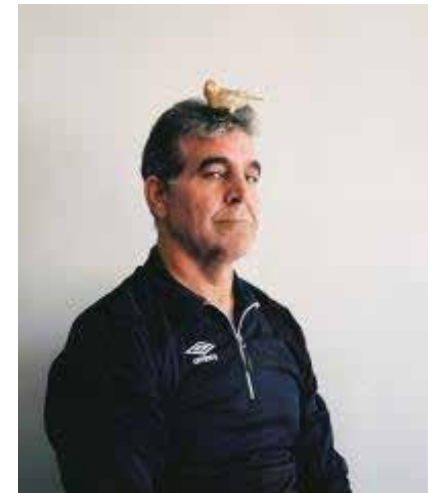
Favez ja Syyrian linnut.

Miten syntymäpäiviä juhliittiin lapsuudessa tai kotimaassasi? Kuka tanssi kuvassa ja millaisen musiikin tahdissa?