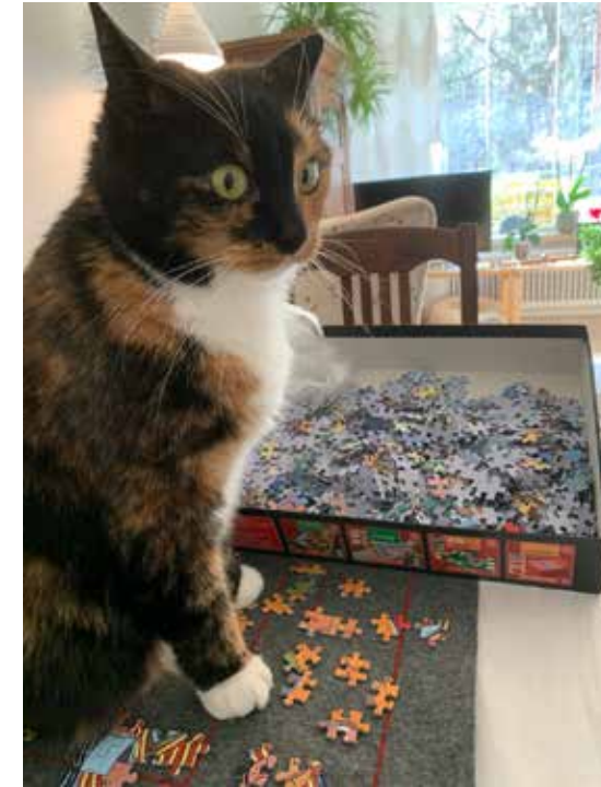
Karanteenissa tehtiin palapelejä