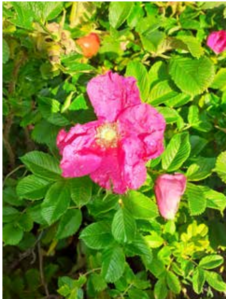
Kurttturuusu Rosa rugosa .

Kurttturuusu Rosa rugosa on viime aikoina ollut otsikoissa erilaisilla puutarhafoorumilla. Syynä on, että se on EU-tasolla ja kansallisesti määritelty haitalliseksi vieraslajiksi. Vieraslajit ovat lajeja, jotka ovat levinneet luontaiselta levinneisyysalueeltaan uudelle alueelle ihmisen mukana joko tahattomasti tai tarkoituksella. Haitalliset vieraslajit aiheuttavat vahinkoa niin luonnolle, terveydelle kuin myös taloudelle. Näitä lajeja ovat kurttturuusun lisäksi muun muassa jättiputki, komealupiini ja jättipalsami. Euroopan unionin vieraslajiasetuksessa säädetään toimenpiteet, joilla jäsenvaltiot pyrkivät estämään haitallisten vieras-